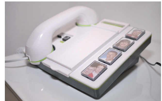
Anruf per Bildwahl: Dieses leicht zu bedienende Telefon und andere Alltagshilfen werden im Portal vorgestellt.

Sind entsprechende Produkte gefunden, können sie auf Wunsch zu einer individuellen, komfortabel druckbaren Broschüre zusammengestellt und dann ausgedruckt oder auch weitergeleitet werden.