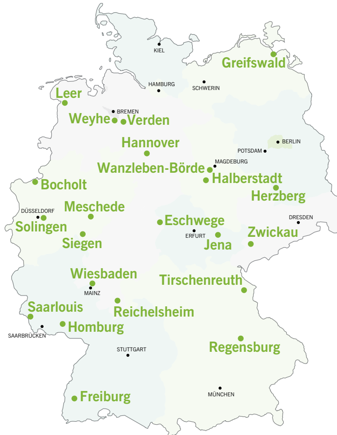
22 Kommunale Beratungsstellen im Bundesgebiet

Das FZI Forschungszentrum Informatik setzt beide Module um. Gemeinsam mit der Hochschule Furtwangen entwickelt das FZI ein Beratungskonzept, das in laufenden Schulungen vermittelt wird. Eine individuell angepasste Beratungssoftware sowie die internen Netzwerkfunktionen des Portals erleichtern den Alltag und ermöglichen den Austausch der Beratungsstellen untereinander.